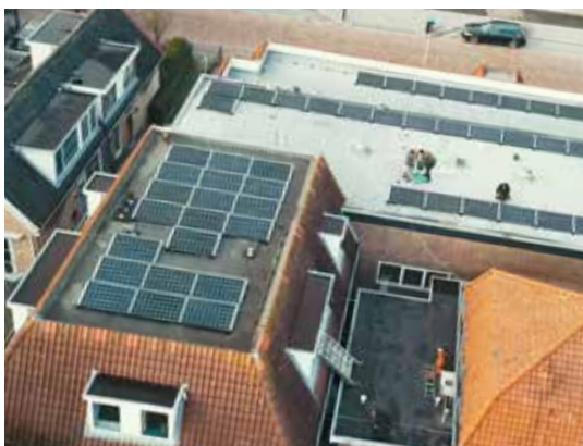
Zonnepanelen in opbouw

Met de 53 zonnepanelen op het dak van het Hervormd Centrum (die zijn betaald van ontvangen legaten) is tot en met oktober 15.500 kWh stroom opgewekt. Daarmee behalen we jaarlijks een besparing van ongeveer € 4.000 op de energierekening en is de investering in 4 jaar terugverdiend. Met moderne 3e generatie thermostaten en spouwmuurisolatie in pastorie en verenigingsgebouwen hebben we in pastorie nu 45% minder gasverbruik. Voor de andere gebouwen hebben we daar ivm lockdown nog geen goed zicht op. De led-spots in de kerk zijn al eerder genoemd, die verbruiken 75% minder stroom dan de oude lampen. We kunnen helaas niet alleen besparingen melden. Het stroomverbruik in de kerk is momenteel fors hoger door het ventilatiesysteem wat meer en harder draait door corona. Daarnaast blijven we kijken wat we nog meer kunnen doen in de toekomst met zonneenergie voor kerk en pastorie.